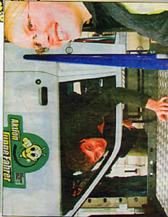
Ausstieg, bitte – aber kopfüber! Am Berufsbildenden Schulzentrum Eßschwitz begrüßt die Kreisverkehrswacht gestern „Junge Fahrer“ zum Aktionstag im Überschlagsmulticar. Rechts: eine anstrengende das Ausstiegen aus einem auf dem Dach liegenden Auto ist.

Alle interessierte Jugendliche sind herzlich zu dieser Veranstaltung eingeladen.